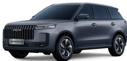
Zircon Gray 14 000 Kč