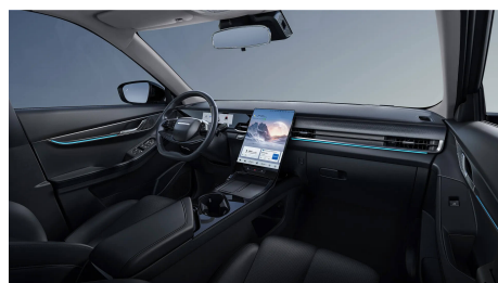
Černý interiér 0 Kč