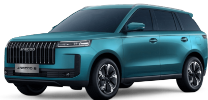
Alpine Green 14 000 Kč