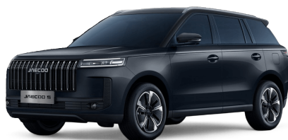
Canyon Black 14 000 Kč