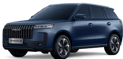
Glacier Blue 0 Kč