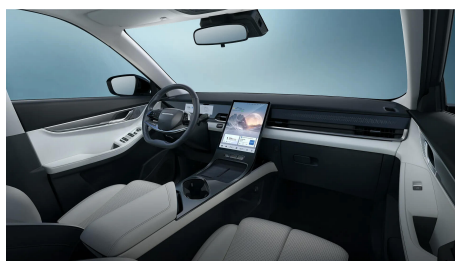
Světle šedý interiér 10 000 Kč