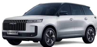
Snowy White / černá střecha 19 000 Kč