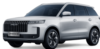
Snowy White 14 000 Kč