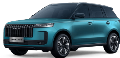
Alpine Green / černá střecha 19 000 Kč