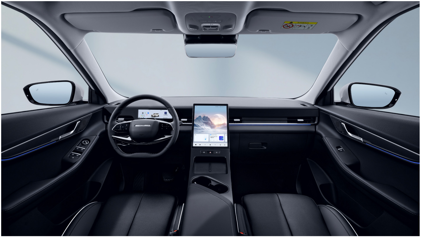
Černý interiér 0 Kč