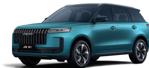
Alpine Green / černá střecha 19 000 Kč