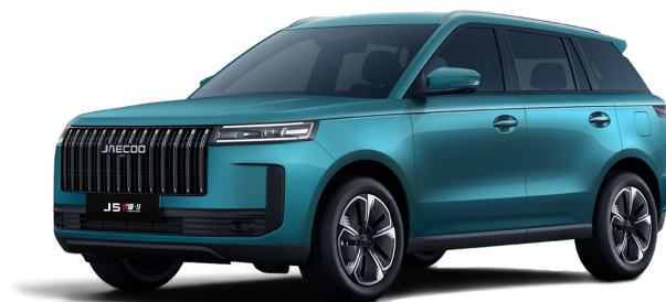
Alpine Green 14 000 Kč