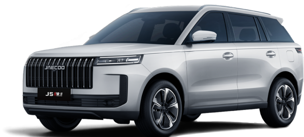
Snowy White 14 000 Kč