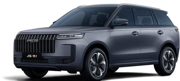
Zircon Gray 14 000 Kč