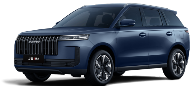
Glacier Blue 0 Kč