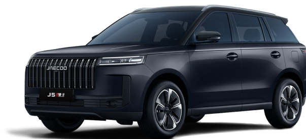
Canyon Black 14 000 Kč