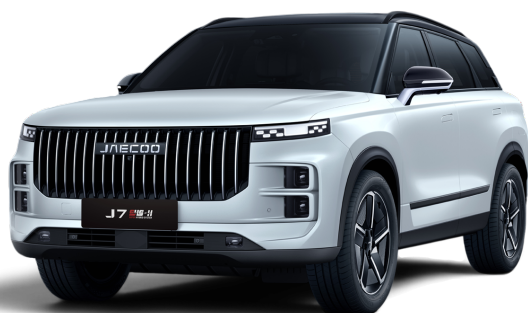
Bílá 0 Kč