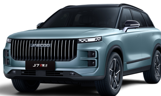
Černá a Šedá 20 000 Kč