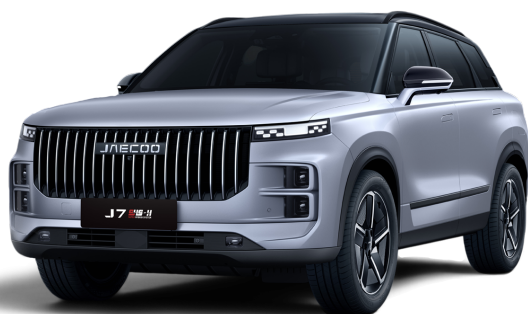
Černá a Stříbrná 20 000 Kč