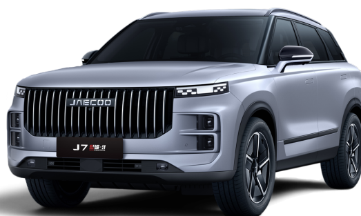
Stříbrná 15 000 Kč