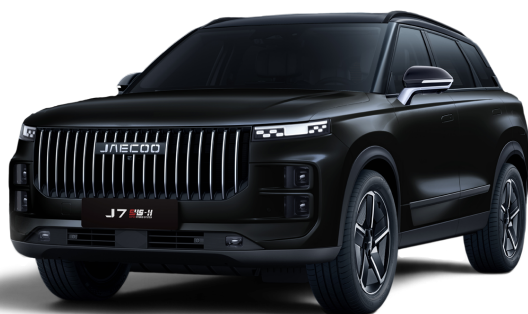
Černá 15 000 Kč