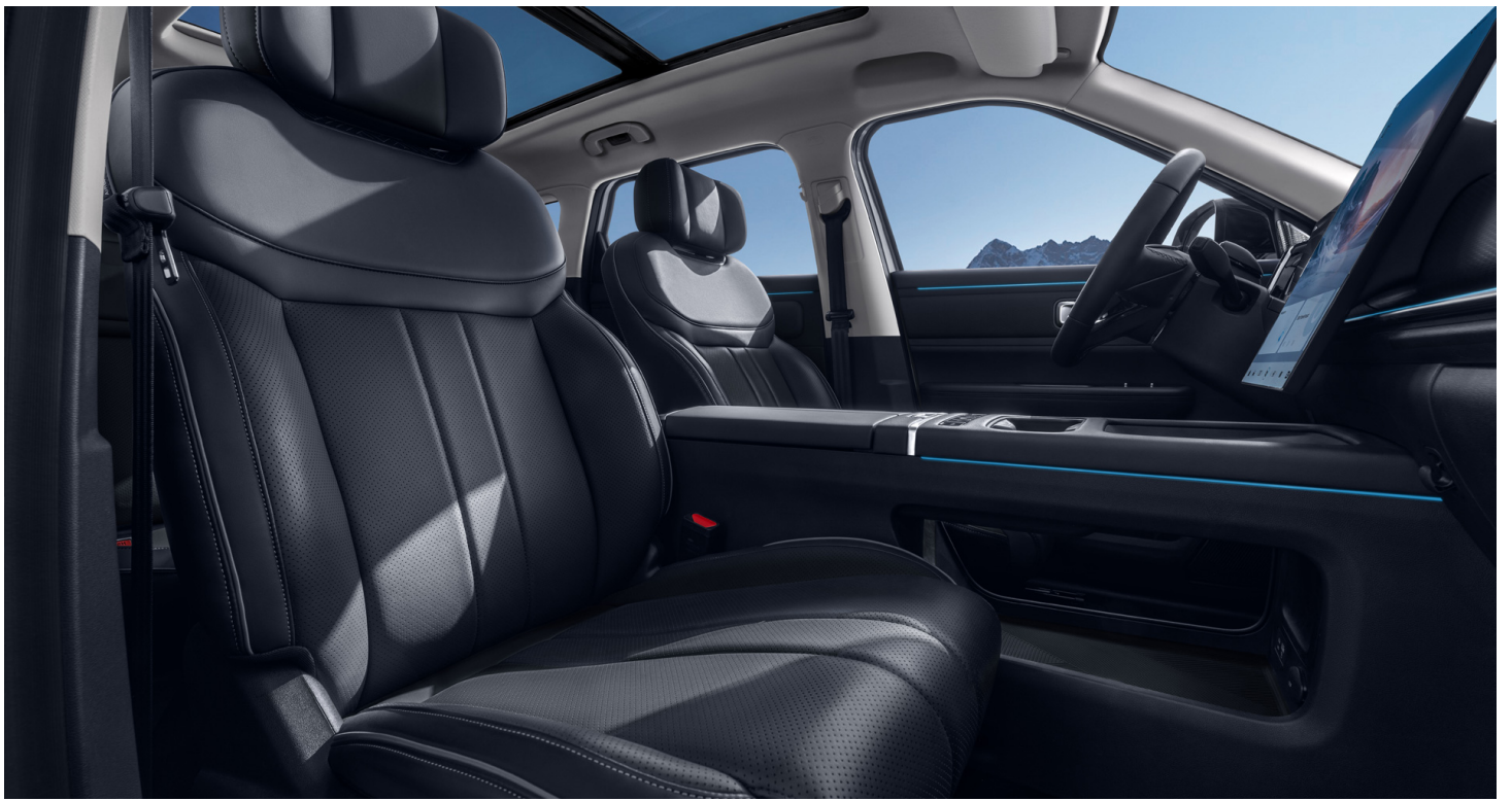
Černý interiér 0 Kč