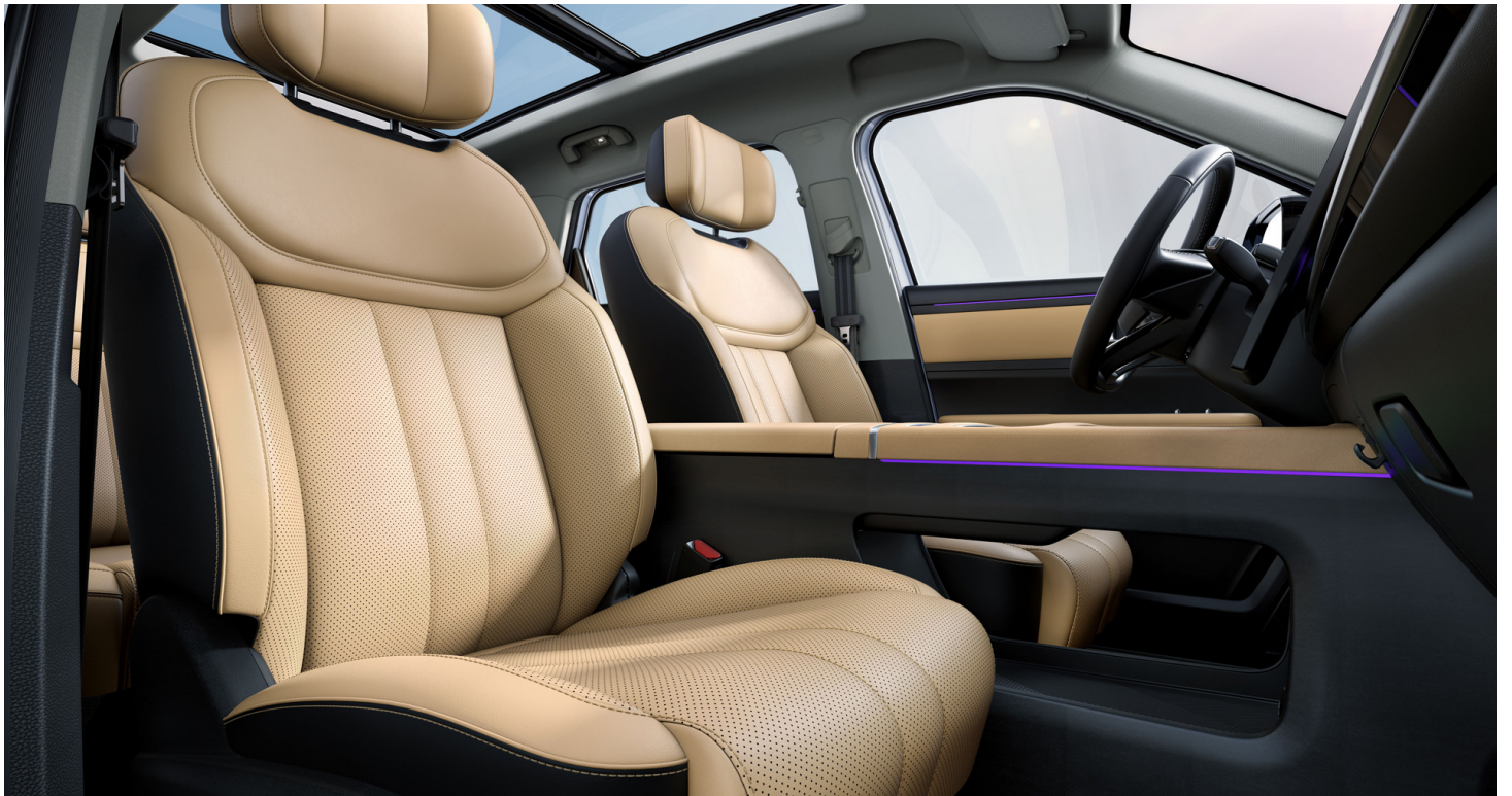
Hnědý interiér 15 000 Kč