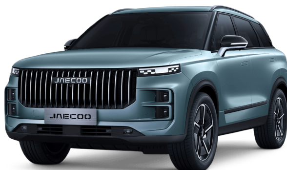
Olivově šedá 15 000 Kč