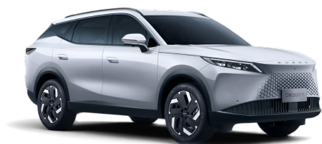
Khaki White 0 Kč