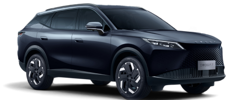
Carbon Black 20 000 Kč