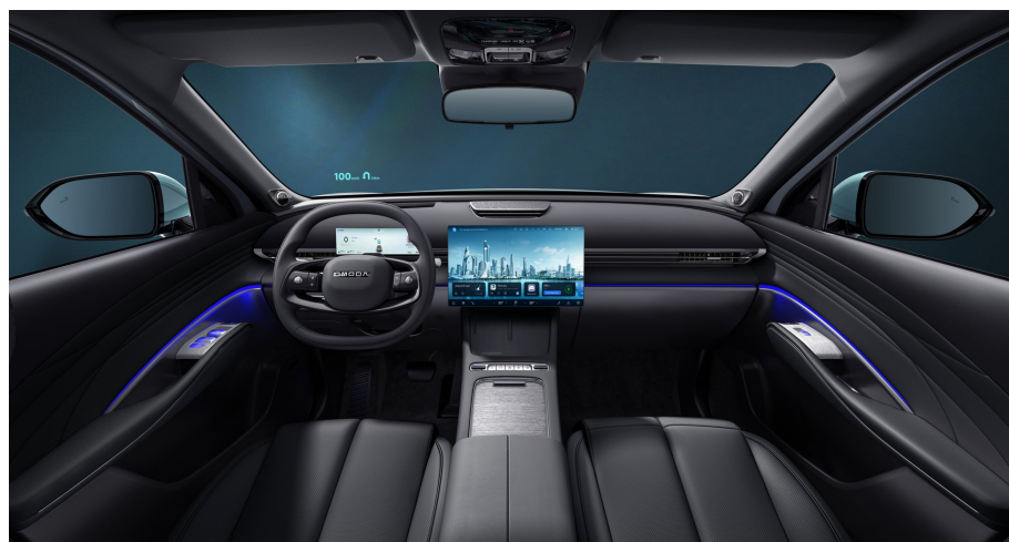
Černý interiér 0 Kč