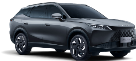
Matte Gray 30 000 Kč