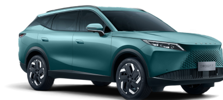
Misty Green 20 000 Kč