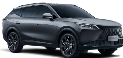
Matte Gray 30 000 Kč