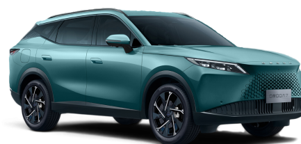
Misty Green 20 000 Kč