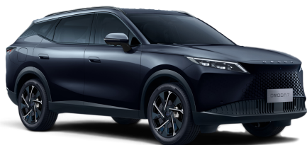
Carbon Black 20 000 Kč