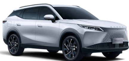
Khaki White 0 Kč