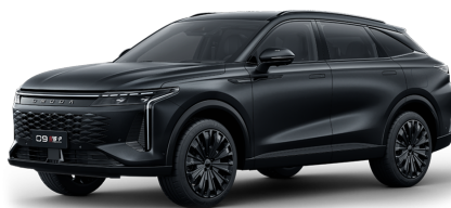
Black Knight 40 000 Kč