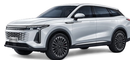
Khaki White 20 000 Kč